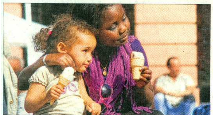
Große Freude: Kinder durften sich nicht nur über ein leckeres Eis freuen.