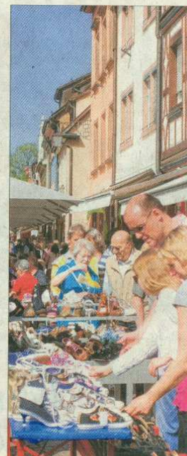
Großes Interesse: Fahrradhändler, Schuhverkäufer, Gastronomie und all die anderen Branchen in der Gengenbacher Innenstadt durften sich beim Einkaufs-Sonntag über viele Besucher und bestimmt einige Neukunden freuen.